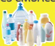
Bouteilles et flacons plastiques