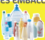
Bouteilles et flacons plastiques