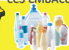
Bouteilles et flacons plastiques