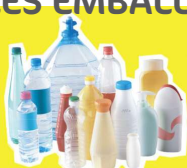
Bouteilles et flacons plastiques