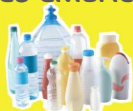
Bouteilles et flacons plastiques