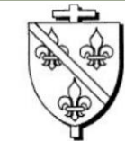
Cardinal Louis de BOURBON- VENDÔME Archevêque de Sens