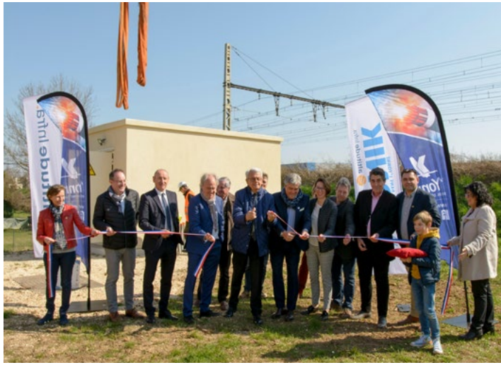
Inauguration du NRO à Saint-Julien-du-Sault - 23 mars 2022

En total, il y en a cinquante-sept qui sont prévus. En termes pratiques, Charny compte 1 990 foyers et sites professionnels connectés à la fibre. Concernant Saint-Julien-du-Sault, 3 637 foyers, entreprises et sites publics sur 7 communes concernées. Le Département de l'Yonne s'est fixé comme échéance globale pour le déploiement de la fibre la fin d'année 2023.